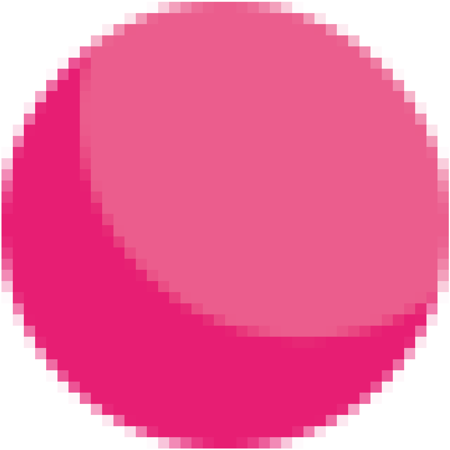
Griotte, Fève de Tonka